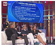
Lista su donne dell'Est, Rai1 nella bufera. Maggioni: