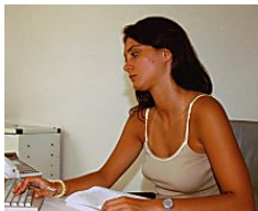
Ecco i lavori più noiosi: scopri se c'è il tuo