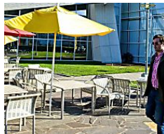
Ecco i 10 lavori dallo stipendio più ricco