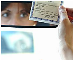
Polizze auto, spunta un altro sito irregolare